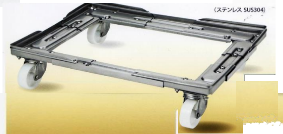
75mmナイロンキャスター使用