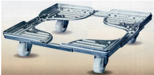
75mmナイロンキャスター使用