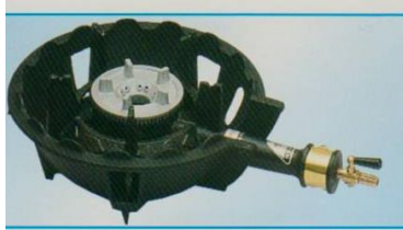
MDX-108 ・ MDX-148