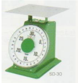
普及・大型・特大型上皿はかり