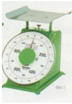
小型・中型上皿はかり